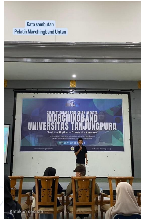
Kata sambutan Pelatih Marchingband Untan