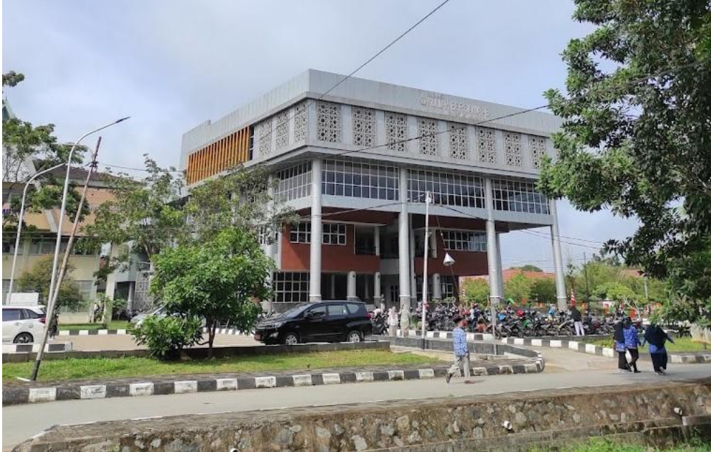
FOTO GEDUNG, RUANGAN, DAN KEGIATAN MUSYAWARAH BESAR KE XIV UKM PP LISMA UNTAN PERIODE 2022-2023 GEDUNG KULIAH BERSAMA B (4.3)