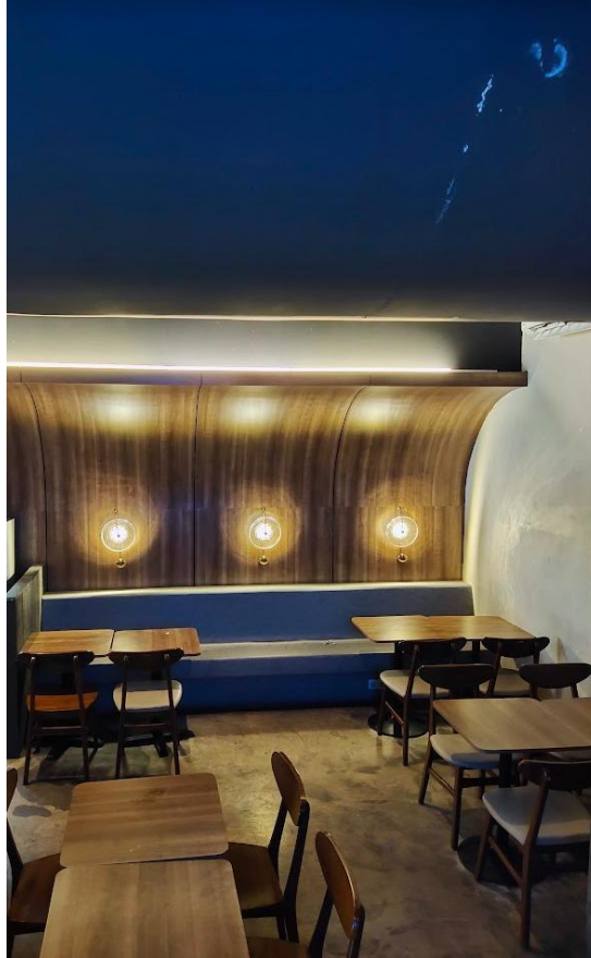
Foto UKM PP LISMA UNTAN