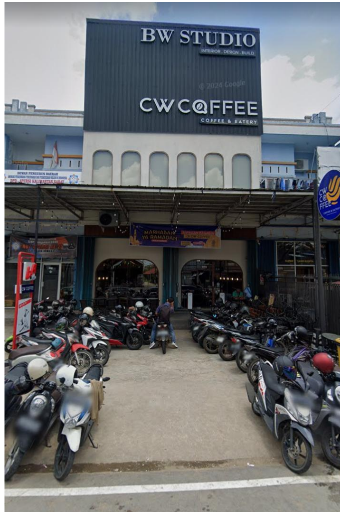
Foto Gedung CW COFFEE Sepakat 2